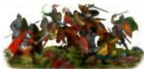
Высший удар злого духа решил исход Куликовской битвы. Русское войско одержало историческую победу.