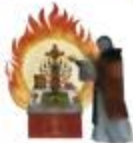
Одним из чудес было возрождение огня в чашку, из которой причащались зеленой молотчицей.