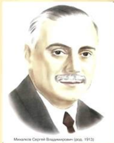
Михалков Сергей Владимирович (род. 1913)