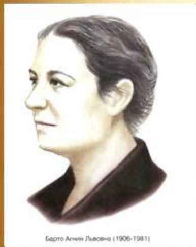
Барто Анна Львовна (1906-1981)