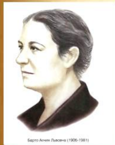
Барто Анна Львовна (1906-1981)