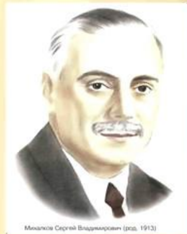
Михалков Сергей Владимирович (род. 1913)