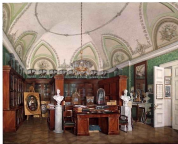
Эдуард Гау. Интерьеры Зимнего дворца. Военная библиотека императора Александра