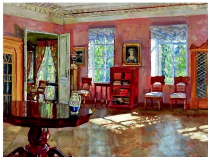
Станислав Жуковский. Библиотека в помещицком доме. 1910-е