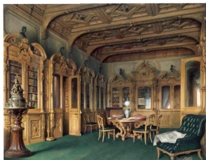
Луиджи Премацци. Особняк барона А.Л.Штиглица. Библиотека. 1870