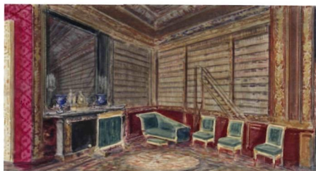
Павел Пясецкий (1843—1919). Библиотека Николая II в замке Компьень