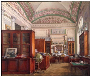
Эдуард Гау. Интерьеры Зимнего дворца. Библиотека императора Александра II