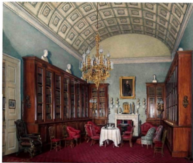
Эдуард Гау. Интерьеры Зимнего дворца. Библиотека императора Александра II