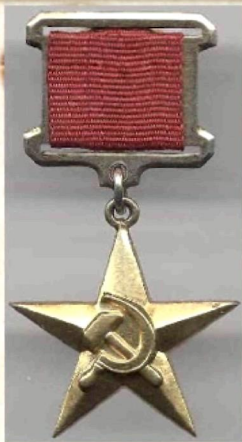
Медаль «Серп и молот»

Указом Президиума Верховного Совета СССР от 27 сентября 1974 года за большие заслуги в развитии советской литературы, активную общественную деятельность Катаеву Валентину Петровичу присвоено звание Героя Социалистического Труда с вручением ордена Ленина и золотой медали «Серп и Молот».