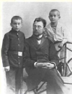
П.В. Катаев с сыновьями , 1910г. Одесса