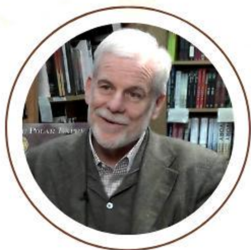
КРИС ВАН ОЛСБУРГ