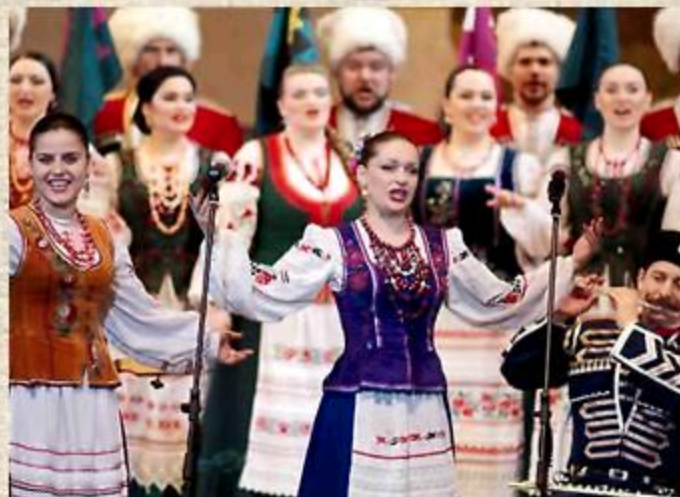
«Ой мий милый варэничкив хоче» народная шуточная песня.