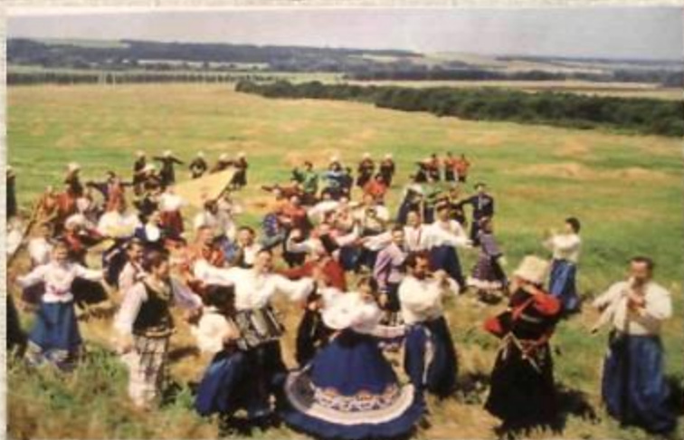
«Роспрягайте, хлопцы, коней» народная строевая казачья песня